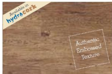
Castle Toast Oak

■ B5P1001 - 1225 x 145 x 6mm | Hydrocork 0,58mm