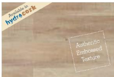
Sawn Bisque Oak

■ B5P1001 - 1225 x 145 x 6mm | Hydrocork 0,58mm